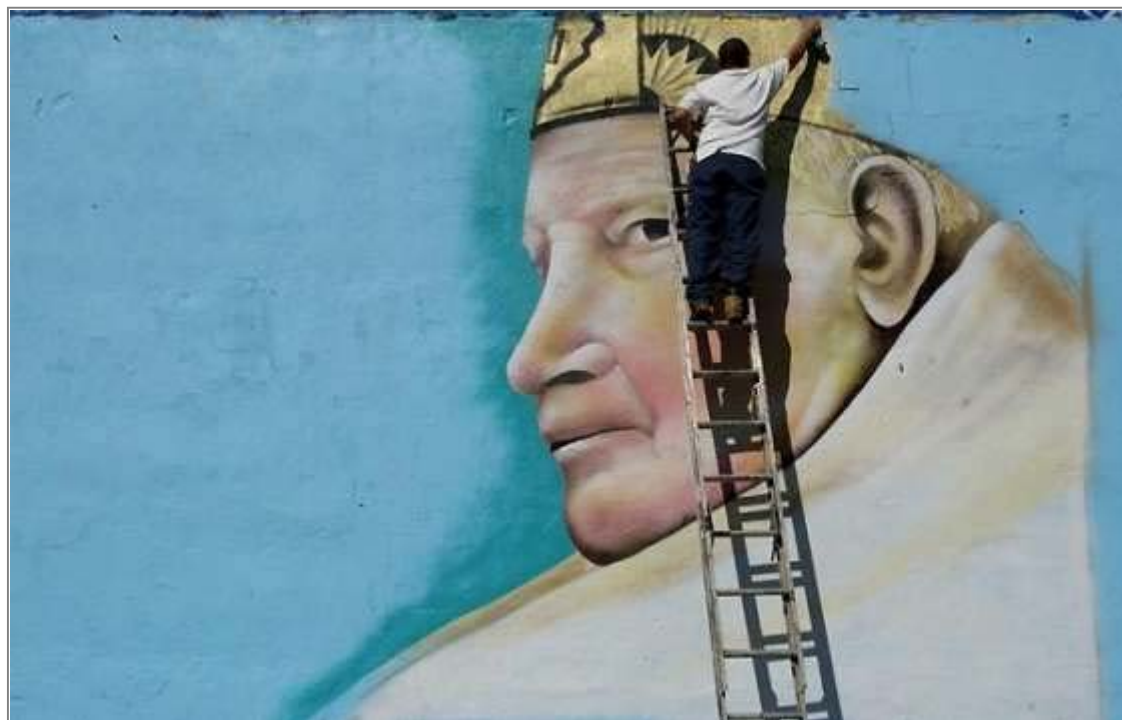
Un grafitero dibuja al Papa Juan Pablo II.

Una empresa catalana especializada en asuntos de criminalidad forense ha creado una aplicación informática que ayudará a reconocer, por medio de un archivo digital, a los autores de los grafitis que invaden las calles de las ciudades y cuya limpieza cuesta miles de euros a los ayuntamientos.