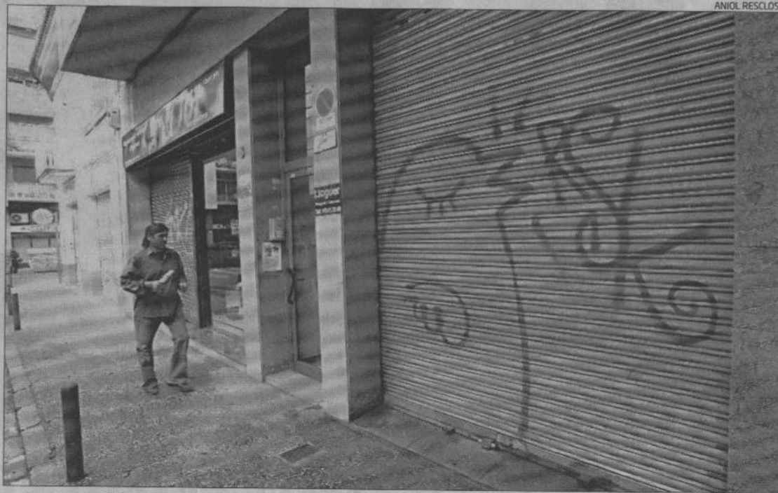
La forma de les signatures i els espais utilitzats permetria identificar els autors, segons els grafòlegs.

ma concreta que «el tag, malgrat haver patit també els efectes de les tendències de cada època i fins i tot de diverses "guerres d'estils" entre grups, té la particularitat que reflecteix la grafia immutable de l'autor i, per tant, permet identificar-lo». Segons els creadors del sistema «la firma té similituds amb l'anònim si bé amb diverses divergències que ens faciliten la identificació. El pintor de tags no