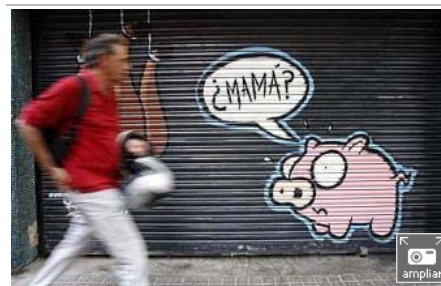
Los grafitis por encargo pueden ser, según sus autores, una alternativa para limitar las pintadas incívicas- GIANLUCA BATTISTA

Este sistema de información quedará abierto para que desde finales de septiembre los ayuntamientos que quieran puedan adoptarlo y modificarlo de acuerdo con sus necesidades. Para ponerlo en marcha se necesitan comenzar con un buen banco de imágenes de los grafitis y un experto en peritaje caligráfico.